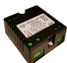
ZQ20-05R0 Z-DIM 48 Wireless LED Dimmer 48V max.7A