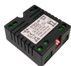
09369 Dimmer 1CH DALI2-PUSH-0/1.10V 24V max11A